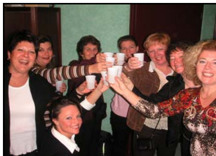
Quelques membres du Fan Club de la Ligue du Relais qui étaient en Alsace avec les joueurs.

Les conjointes, les enfants, les petits-enfants, les serveurs et serveuses des 4 Glaces de Brossard ainsi que les remplaçants et anciens joueurs sont membres d'office.